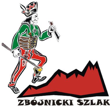
Logo „Zbójnicki szlak”

Zbójnictwo karpackie było i jest nadal tematem zainteresowania badaczy różnych dziedzin. Na jego temat powstało wiele prac naukowych i utworów literackich. Mit zbójnicki, oparty na micie bohaterskim, wolności i poczuciu niezależności, stał się ważnym wątkiem folkloru. Takim pozytywnym bohaterem, owianym wieloma legendami, był m.in. Janosik, buntownik przestrzegający zbójnickich zasad.