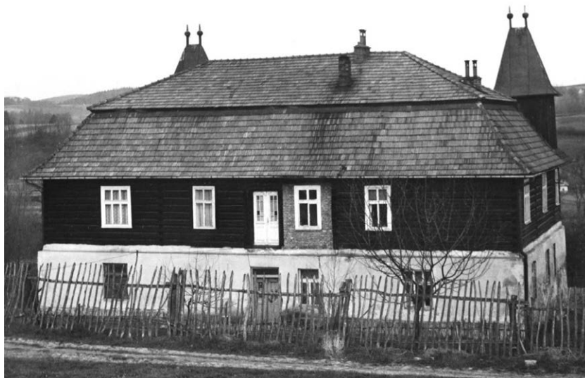
Dwór w Dąbrówce, elewacja południowa, na lata 80. XX wieku

W związku z nowym – turystycznym – charakterem wsi Dąbrówka, została przygotowana przez Gminę Stryszów wstępna koncepcja zamiany dworu w siedzibę Centrum Rekreacji i Wypoczynku, w którym byłyby m.in. prezentowane znaleziska archeologiczne z dna jeziora. Dwór został zmodernizowany i dostosowany do typu budynku użytku publicznego, wskutek czego zmieniono jego konstrukcję. Wpisanie obiektu w nowy charakter wsi było uzasadnione przede wszystkim tym, że Łubieński nadał swojemu dworowi cechy willi letniskowej, typowej dla kurortów wypoczynkowych.