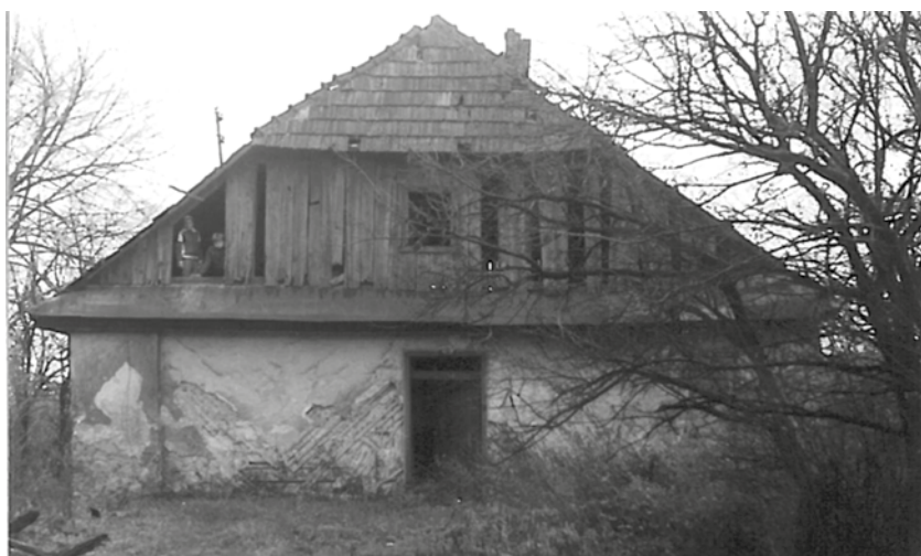
Zachodnia elewacja – wejście do budynku, druga połowa lat 80. XX w.

Nadwężona więźba i obawa zawalenia się były powodem do rozbiórki dachu w 1991 roku. Do końca ubiegłego wieku stały jeszcze zrujnowane ściany budynku. Syn ostatniego właściciela, mieszkający pod Krakowem w dwóch ratach sprzedał to, co zostało jeszcze po gospodarstwie ojca – zrujnowane budynki wraz z polem. Resztki ścian dworu oraz pozostałości po dużej stodole – masywne kamienne filary, zostały przez nabywcę rozebrane.