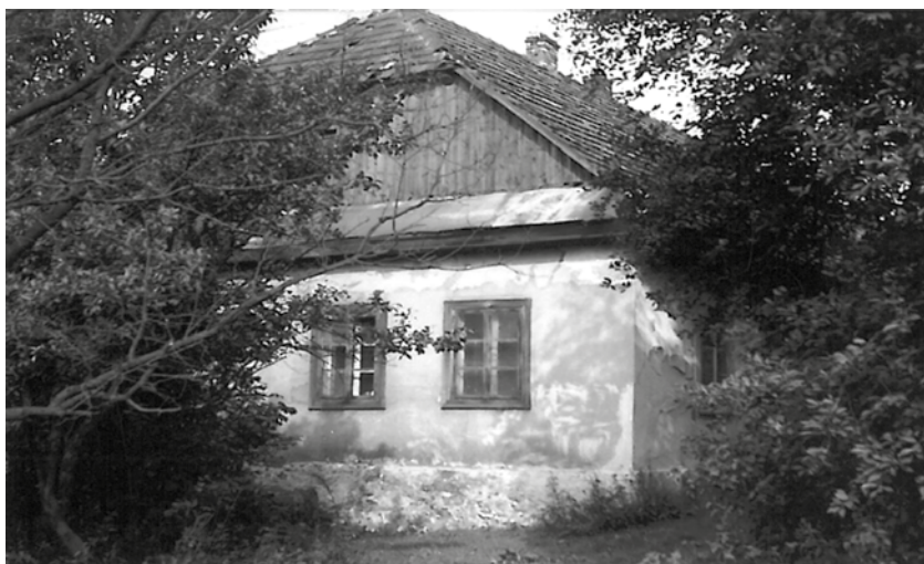
Wschodnia elewacja dworu, początek lat 80. XX w.