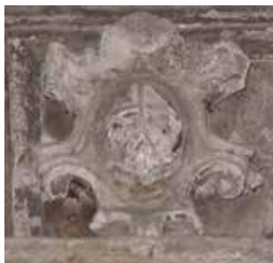
Herb „Kościeszka” lub gmerk na epitafium Anny z Wochów i Hieronima Spineka.