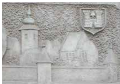
Herb Olkusza na tablicy pamiątkowej.

Amendzińskiej przy olkuskiej świątyni. Wykonana z brązu tablica upamiętnia pobyty kardynała Karola Wojtyły w Olkuszu w 1967 i 1973 roku. U góry tablicy znajduje się panorama Olkusza w średniowieczu oraz herb miasta 15 . Herb jest niemal identyczny z wizerunkiem herbu, jaki był stosowany od lat 60. XX wieku. Wyróżnia go trójkątna kopaczka skierowana ostrzem ku górze oraz baszty z kamiennych ciosów. W tym przypadku herb symbolizuje fundatora zbiorowego, czyli mieszkańców Olkusza, a nie jego władze.