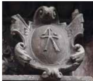
Herb „Kościesz” rodziny Łączyńskich na epitafrum.