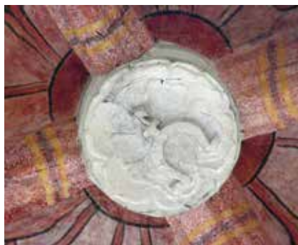
Gmerk w zworniku sklepienia kaplicy św. Anny w Olkusz.

Jak zatem widać gmerki olkuskich mieszczan nadal kryją wiele tajemnic 54 .