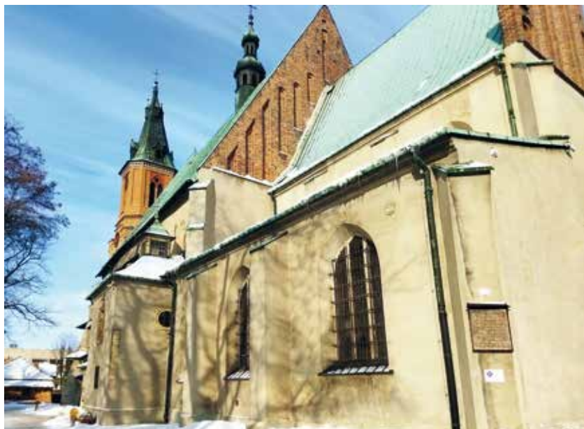
Bazylika mniejsza pw. św. Andrzeja Apostoła w Olkuszu.

Celem artykułu jest próba zebrania, a także poprawnego opisanie oraz datacji i identyfikacji wszystkich elementów heraldycznych, jakie znajdują się w olkuskiej bazylice mniejszej pw. św. Andrzeja Apostoła 1 . W przypadku gmerków i herbów szlacheckich podawane są krótkie biogramy osób, które je używały. Pierwsza wzmianka dotycząca olkuskiego kościoła jest datowana na 1317 rok. Jednak najstarsza część świątyni wybudowana w stylu późnoromańskim została wzniesiona jeszcze w XIII wieku. Stanowi ona obecne prezbiterium. Kościół został rozbudowany w stylu gotyckim za panowania króla Kazimierza Wielkiego, a w XV wieku dobudowano kaplicę św. Anny. Pod koniec XVI wieku rozpoczęła się przebudowa kościoła. W 1620 roku powstała renesansowa kaplica Loretańska, zwana też Amendzińską, wzorowana na kaplicy Zygmuntońskiej na Wawelu. Wtedy też dobudowano dużą i małą kruchtę, czyli przedsionki kościoła. Pod koniec XVIII wieku obok kościoła wybudowano kaplicę św. Jana Kantego, a w 1913 roku wzniesiono wysoką, neogotycką dzwonnice. Przez wieki olkusczy mieszczaństwo fundowali elementy