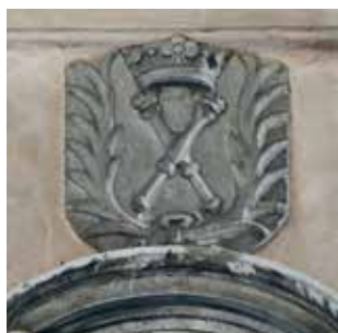
Herb Akademii Krakowskiej nad wejściem do kaplicy św. Jana Kantego w Olkuzie.

Warto dodać, że herb Akademii Krakowskiej, którego godłem są skrzyżowane berła królewskie, przez wieki podlegał minimalnym modyfikacjom. Korona ponad berłami pojawia się dopiero w połowie XVII wieku.