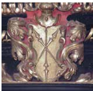
Herb „Jelita” na ołtarzu św. Antoniego w olkuskim kościele.