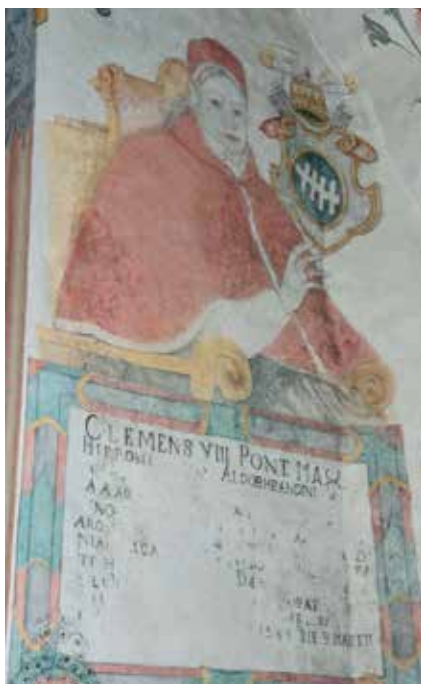
Polichromia przedstawiająca papieża Klemensa VIII oraz jego herb.