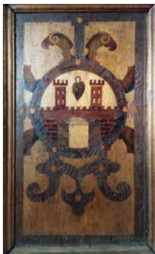
Herb Olkusza na stallach w kościele św. Andrzeja w Olkuszu.