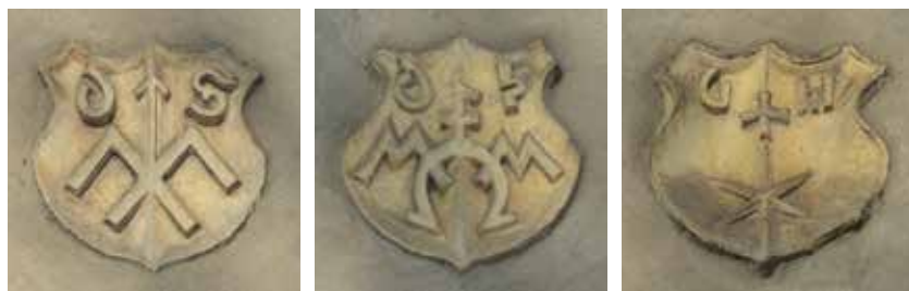
Gmerki na zewnętrznej ścianie kaplicy św. Anny.

z pieczęci z 1584 roku. Występują też pewne podobieństwa do gmerku krakowskiego rajcy Bartłomieja Habychta z 1550 roku 53 .