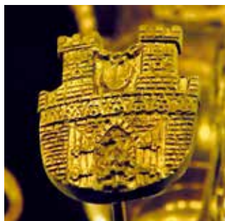
Herb Olkusza na žyrandolu w kościele św. Andrzeja w Olkuszu.

Od wcześniejszych wyobrażeń różni go umieszczenie orła w otwartej bramie miejskiej i fakt, że górnicza kopaczka została zawieszona na łańcuchu. Herb w takiej formie znany jest z licznych zabytków zachowanych w mieście (ceramiczne herby z 1898 r. na budynku magistratu i szkół, pieczęcie