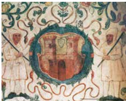
Herb miasta na ścianie prezbiterium olkuskiej bazyliki mniejszej pw. św. Andrzeja Apostoła.