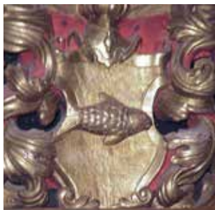
Herb „Glaubicz” na ołtarzu św. Antoniego w olkuskim kościele.

gmerków i znaków cechowych wiązało się z ogólnym upadkiem mieszczaństwa oraz likwidacją organizacji cechowej. Ostatnie polskie gmerki pochodzą z przełomu XVIII i XIX wieku. Zachowane do dzisiaj gmerki olkuskich mieszczan można znaleźć na pieczęciach, którymi sygnowali dokumenty. Sporadycznie spotykamy gmerki na bochnach olkuskiego ołowiu. W Olkuszu można zobaczyć mieszczańskie gmerki na ścianach trzech kamienic w rynku. Najwięcej gmerków mieszczan olkuskich zachowało się w bazylice św. Andrzeja. Były umieszczane na tablicach epitafijnych lub elementach wyposażenia kościoła fundowanych przez bogatych gwarków. Jednak najwięcej gmerków zachowało się na pieczęciach, których używali mieszcianie. Jedynie drobna część z nich została zbadana i opracowana naukowo 34 .