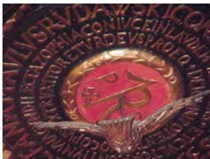
Gmerk Pawła Rudawskiego na suficie baldachimu ambony w olkuskim kościele.