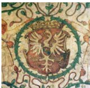
Herb Królestwa Polskiego na ścianie prezbiterium olkuskiego kościoła.

Takie właśnie wyobrażenie zostało przedstawione na polichromii w Olkuszu 64 .