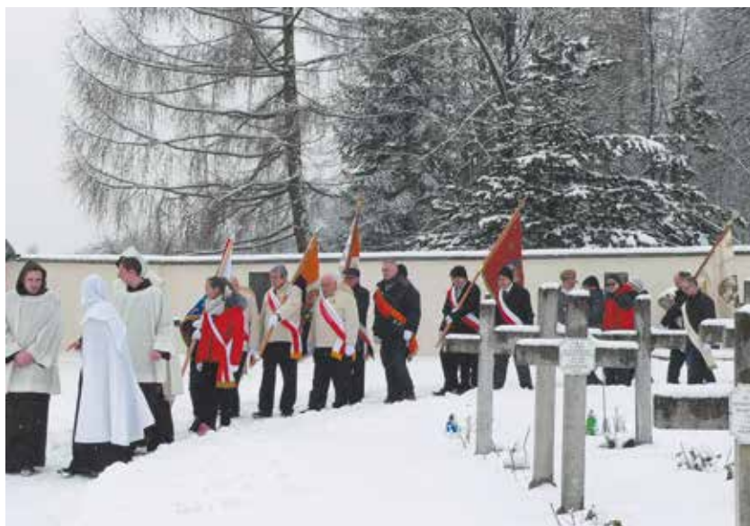
Ojcowie karmelici i poczty sztandarowe kierują się na miejsce pierwszego grobu św. Rafała.

Podczas wydarzeń Franciszek Rozmus zrealizował filmy dokumentalne, które można zobaczyć na Facebooku, na stronie Olkusz.tv, w zakładce „filmy”: Kucie kos powstańczych. Czerna 2020 oraz Pokaz kucia kos powstańczych w klasztorze Karmelitów Bosych w Czernej 5.02.2023 r. 13