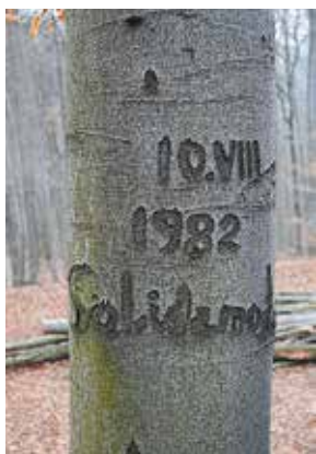
Inskrypcja na czerneńskim buku. Archiwum oo. Karmelitów Bosych w Czernej

gm. I pf. drukowanej... 2 , opisanym dokładnie w dokumencie mianowania 3 , który potwierdza gruntowne przygotowania do objęcia władzy przez Rząd Narodowy Polski i przypomina, że powstanie miało także charakter polityczny.