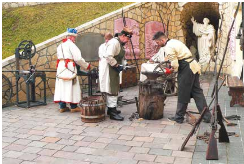
Kucie kos.