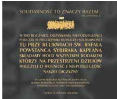
Tablica upamiętniająca stulecie odzyskania niepodległości i 35. pielgrzymkę Duszpasterstwa Hutników do św. Rafała.