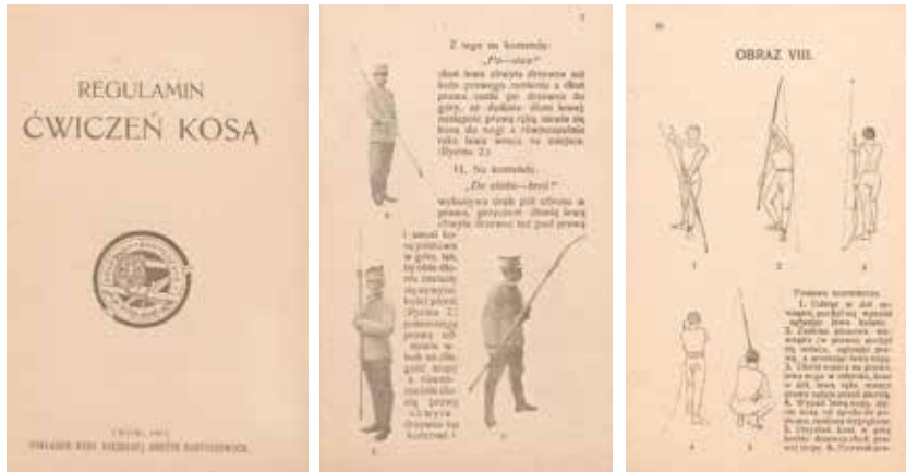
Regulamin ćwiczeń kosą, Lwów 1913.

Kosy znane były już w starożytności. O możliwościach ich wykorzystania pisał w Krótkiej nauce o pikach i kosach Piotr Aigner, architekt i wojskowy: